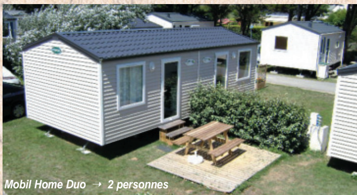
Mobil Home Duo → 2 personnes