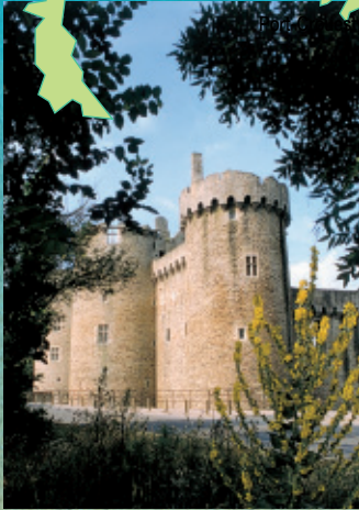
Le Château de Suscinio (Résidence des Ducs de Bretagne)