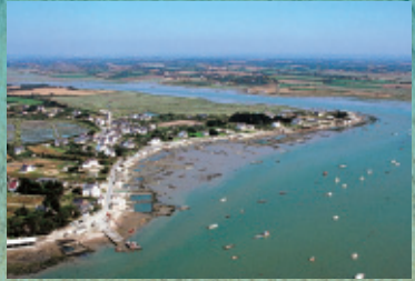
La route de l'huître - Le Tour du Parc

A 8 km de Sarzeau Centre Ville A 23 km de Vannes