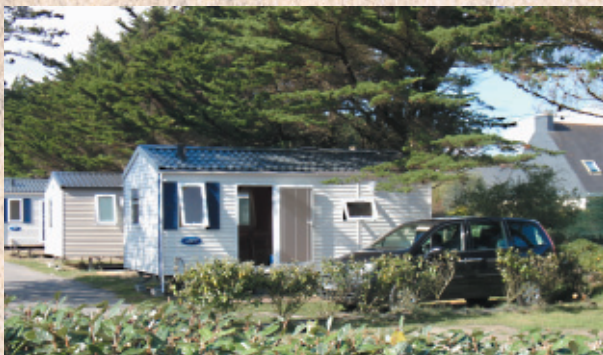
Mobil Home 4 ou 6 personnes