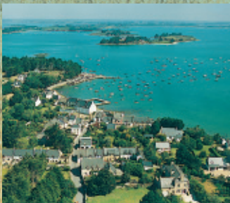
Le Golfe du Morbihan avec escales sur l'île aux Moines ou l'île d'Arz