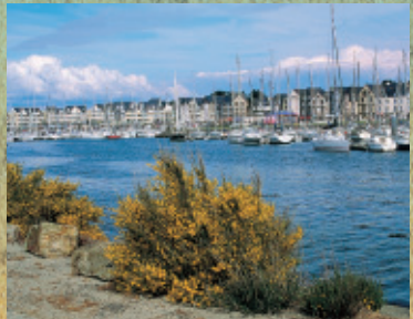
Le Port du Croesty à Arzon (Casino/Thalassothérapie)